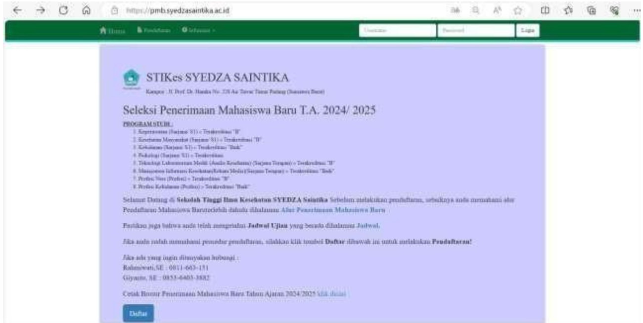
Gambar 1. Halaman Utama Pendaftaran Online